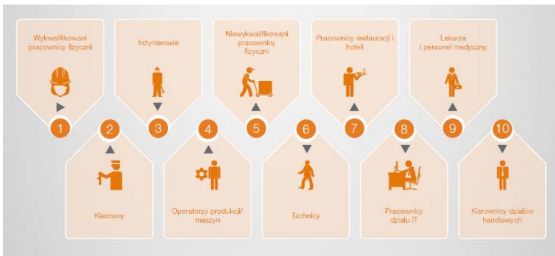
Rys. 2. 10 grup zawodowych objętych największym deficytem w Polsce.

Niezmienne od kilku kolejnych lat, grupą zawodową, której przedstawicieli znaleźć jest najtrudniej są wykwalifikowani pracownicy fizyczni. Do puli tej należą m.in. mechanicy, elektrycy, spawacze, monterzy, operatorzy wózków widłowych, murarze, drukarze, stolarze czy tokarze. Na drugim miejscu znaleźli się kierowcy, a zaraz za nimi inżynierowie, którzy zamykają pierwszą trójkę. Na kolejnym miejscu uplasowali się operatorzy produkcji/ maszyn. Zestawienie pokazuje też, że nie w każdej sytuacji kompetencje są najważniejszym czynnikiem poszukiwań. Liczy się również zaangażowanie i chęć do pracy, czego dowodem jest pozycja piąta i umieszczeni na niej niewykwalifikowani pracownicy fizyczni. O pracowników ciężko również na stanowiskach techników z różnych obszarów, a także personelu rozwijającego się ciągle sektora restauracje i hotele, zajmujących odpowiednio miejsca szóste i siódme. Otoczeni stereotypem najtrudniejszych do znalezienia, pracownicy działów IT znaleźli się dopiero na ósmej pozycji. Natomiast przedostatnie miejsce zajęli lekarze i personel medyczny. Dziesiątkę grup zawodowych obarczonych największym niedoborem talentów zamykają kierownicy działów handlowych. Utrzymanie się popytu na tych pracowników jest też potwierdzeniem tego, że rynek staje się coraz bardziej konkurencyjny, a o przewadze decydują nie tylko produkty, ale też potencjał sprzedażowy firm.