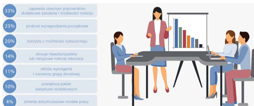
Rys. 4. Działania zapobiegawcze, jakie są podejmowane przez Pracodawców w Polsce i na świecie.

W badaniu ManpowerGroup zapytano również menedżerów HR na całym świecie o strategie podejmowane w obliczu niedoboru talentów . Blisko połowa firm w Polsce (33%) i ponad jedna trzecia organizacji w ujęciu globalnym (53%) próbuje uporać się z problemem wdrażając nowe praktyki HR, takie jak dodatkowe szkolenia i możliwości rozwoju dla obecnych pracowników. Pracodawcy w naszym kraju chętniej podwyższają też stawki wynagrodzeń (23%) i sięgają po wsparcie w wyspecjalizowanych firm doradztwa personalnego (20%). Poszukują również nowych, sposobów rekrutacji (14%). Korzystają też z nowych metod docierania do kandydatów oraz rozszerzają kryteria rekrutacji, aby uwzględnić osoby, którym brakuje niektórych wymaganych umiejętności lub kwalifikacji, ale posiadają potencjał do ich zdobycia (11%).