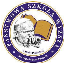
Rys. 2. Logo Państwowej Szkoły Wyższej im. Papieża Jana Pawła II w Białej Podlaskiej

Rysunki, ryciny, fotografie i mapy zamieszczone w pracy dyplomowej powinny być grupowane. Nie powinno się zamieszczać ich skanów. Rysunki, ryciny, fotografie i mapy muszą być czytelne, zrozumiałe i opisane z powołaniem się na źródło. Przykładowy wzór przedstawiono na rysunku 2.